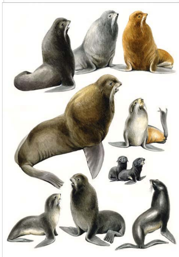
Примеры работ В. Смирин для Атласа ластоногих Европы и Северной Азии. Вверху – Лист Атласа с изображениями сивуча и моржа. Внизу – Лист Атласа, посвященный северному морскому котику.