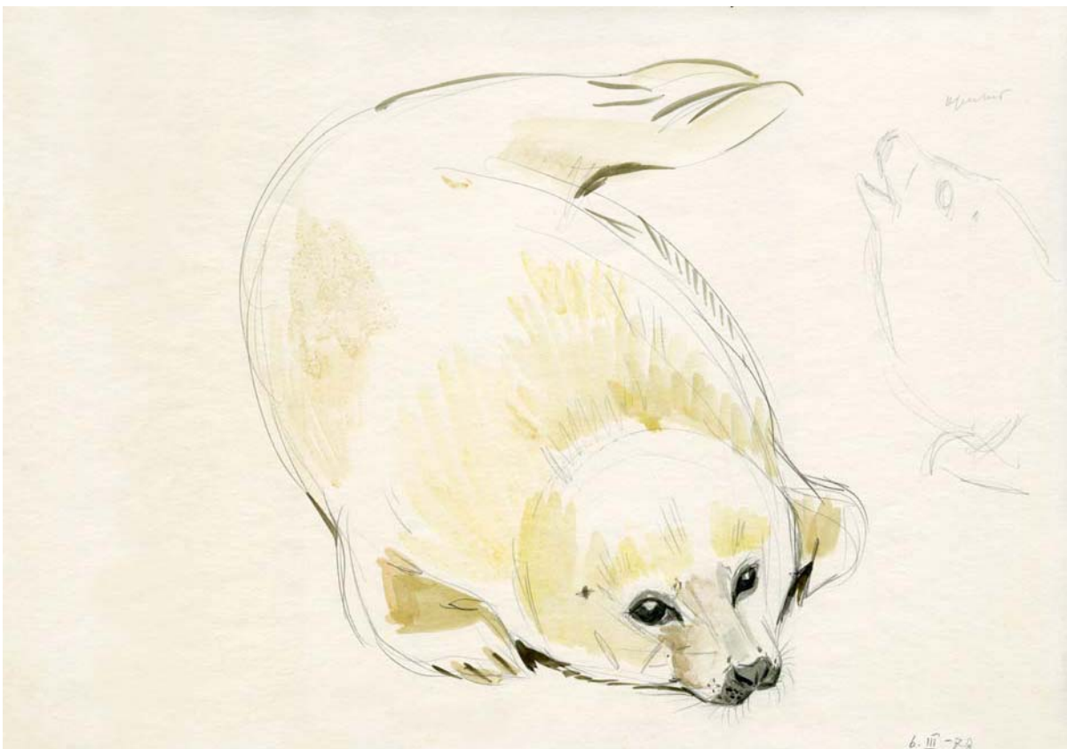
Примеры работ В. Смирин для Атласа ластиногих Европы и Северной Азии. Вверху – Новорожденный детеныш северного морского котика. Командорские острова, остров Медный, 1976 г. Внизу – Белек гренландского тюленя. На льдах в горле Белого моря. 1978 г.