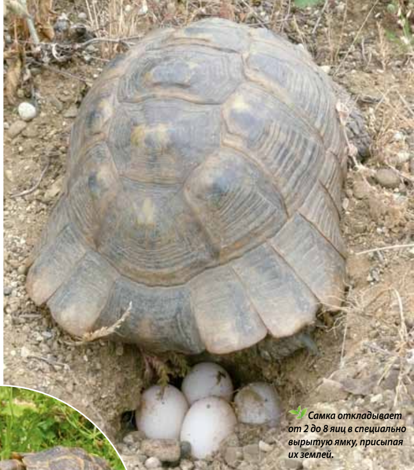
Самка откладывает от 2 до 8 яиц в специально вырытую ямку, присыпая их землей.

Увы, в подавляющем большинстве случаев условия содержания черепах в неволе далеки от оптимальных. Обеспечить этим рептилиям необходимый для них уход,