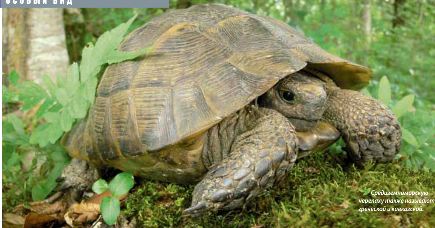
Средиземноморскую черепаху также называют греческой и кавказской.