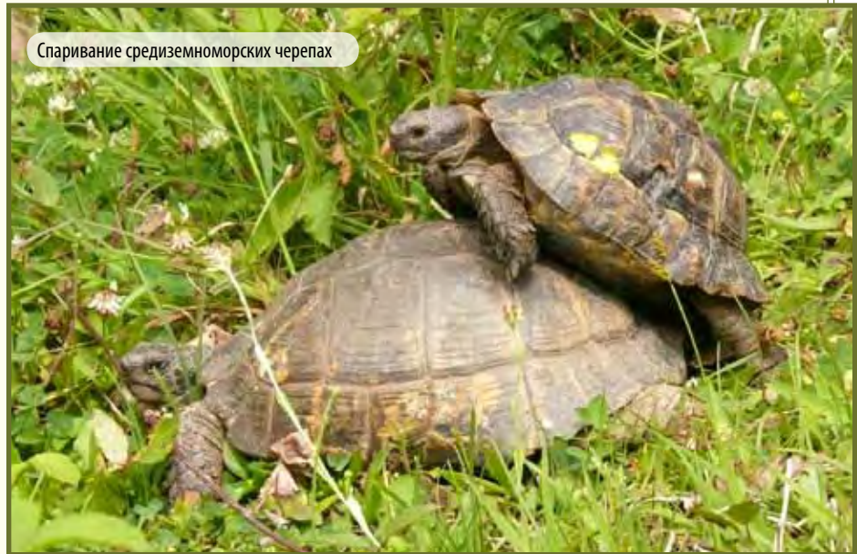
Спаривание средиземноморских черепах