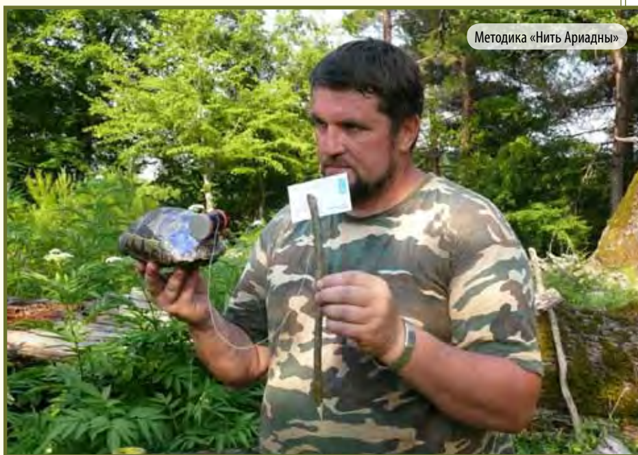
Методика «Нить Ариадны»