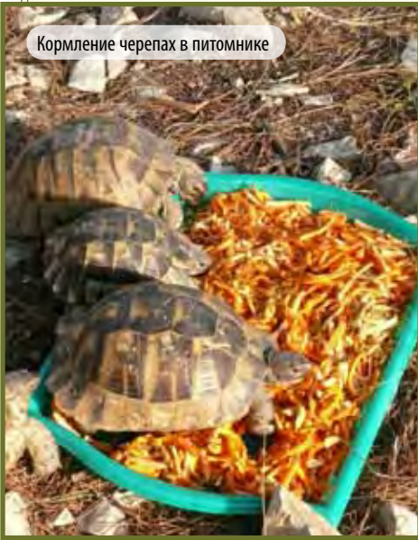
Кормление черепах в питомнике