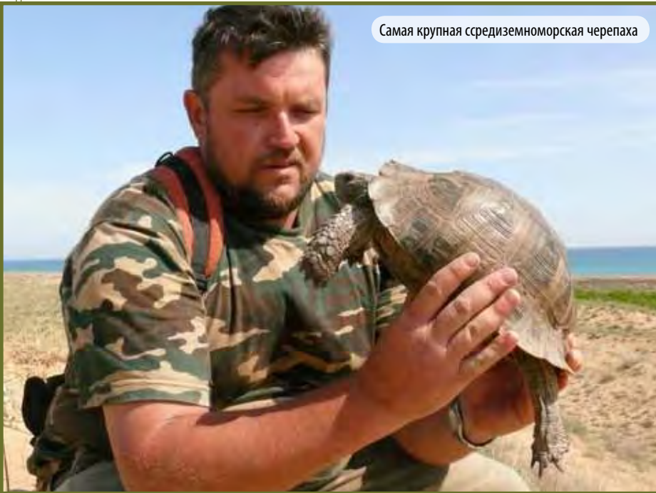
Самая крупная средиземноморская черепаха

ценных участков Утриша. Подробнее с этой проблемой можно познакомиться на сайте Экологической вахты по северному Кавказу, которая координирует усилия по созданию заповедника: http://ewnc.org/utrish