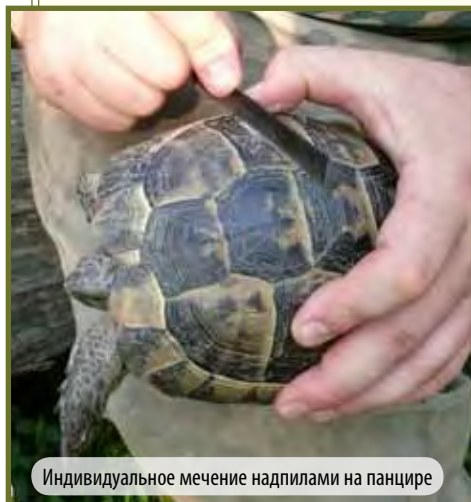
Индивидуальное мечение надпилами на панцире